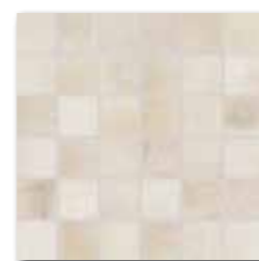
DDM05710 (SET) PEI 5 ○ 72 / set mat | matt