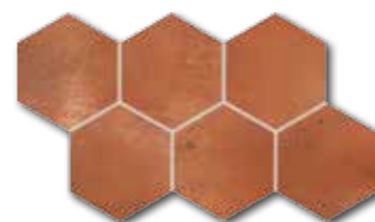
DDVT8712 (SET) PEI 4 ○ 74 / set mat | matt

šedá / grey / szara / серый / szürke / gris