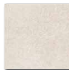
DAR34710 PEI 5 ○ 74 / m 2 mat | matt