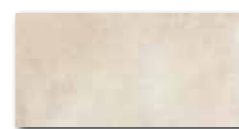
DARJH710 PEI 5 ○ 84 / m 2 mat | matt