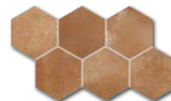
DDVT8713 (SET) PEI 4 ○ 74 / set mat | matt

červeno-hnědá / red-brown / czerwono-brązowy красно-коричневый / vörösesbarna / de color marrón rojizo