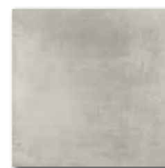
DAR34711 PEI 4 ○ 74 / m 2 mat | matt