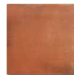
DAR34712 PEI 4 ○ 74 / m 2 mat | matt