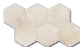
DDVT8710 (SET) PEI 5 ○ 74 / set mat | matt

světle béžová / light beige / jasnobežowa светло-бежевый / világosbézs / beige claro