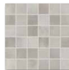
DDM05711 (SET) PEI 4 ○ 72 / set mat | matt