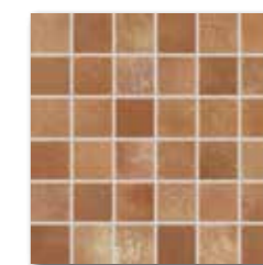
DDM05713 (SET) PEI 4 ○ 72 / set mat | matt