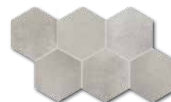
DDVT8711 (SET) PEI 4 ○ 74 / set mat | matt

světle béžová / light beige / jasnobežowa светло-бежевый / világosbézs / beige claro