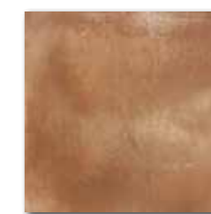
DAR34713 PEI 4 ○ 74 / m 2 mat | matt