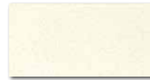
WATMB041 ○ 72 / m 2 mat/lesk | matt/glossy světle žlutá / light yellow / jasnozółta светло-желтый / világossárga amarillo claro