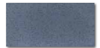
WATMB045 ○ 72 / m 2 mat/lesk | matt/glossy tmavě modrá / dark blue / ciemnoniebieska sиний / sötétkék / azul oscuro