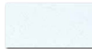
WATMB044 ○ 72 / m 2 mat/lesk | matt/glossy světle šedomodrá / light grey-blue jasnoszaro-niebieska / светло-серо-голубой világosszürke-kék / luz gris-azul