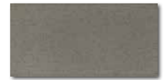
WATMB046 ○ 72 / m 2 mat/lesk | matt/glossy šedohnědá / grey-brown / szarobrązowa серо-коричневый / barna-szürke / gris-marrón