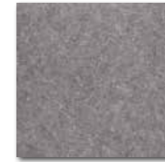
DAA34636 Rock PEI 5 72 / m 2 mat | matt

světle šedá / light grey jasnoszara / светло-серый világosszürke / gris claro