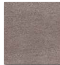
DAA3B612 Unistone PEI 5 70 / m 2 mat | matt

běžová / beige / bežowa / бежевый bézs / beige