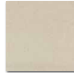
DAA34633 Rock PEI 5 72 / m 2 mat | matt

šedá / grey / szara / серый szürke / gris