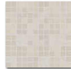
DDM0U610 (SET) Unistone PEI 5 82 / set mat | matt

běžová / beige / bežowa бежевый / bézs / beige