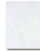
WATG6022 59 / m 2 lesk | glossy

běžová / beige / bežowa бежевый / bézs / beige