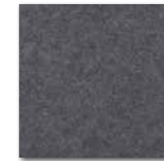
DAA34635 Rock PEI 5 72 / m 2 mat | matt

tmavě šedá / dark grey ciemnoszara / темно-серый sötétszürke / gris oscuro