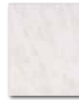
WATG6023 59 / m 2 lesk | glossy