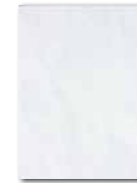
WATKB098 64 / m 2 lesk | glossy