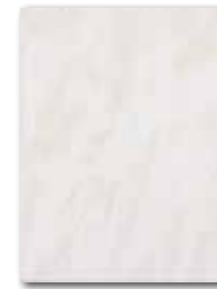
WATKB099 64 / m 2 lesk | glossy