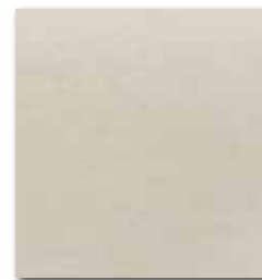
DAA3B610 Unistone PEI 5 70 / m 2 mat | matt

bílá / white / biata / белый fehér / blanco