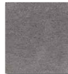
DAA3B611 Unistone PEI 5 70 / m 2 mat | matt

šedohnědá / grey-brown / szarobrazowa / серо-коричневый / barna-szürke / gris-marrón