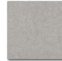
DAA34634 Rock PEI 5 72 / m 2 mat | matt

bílá / white / biata / белый fehér / blanco