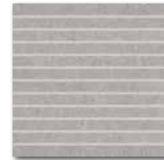
DDP34634 (SET) Rock PEI 5 72 / set mat | matt

světle šedá / light grey / jasnoszara / светло-серый világosszürke / gris claro