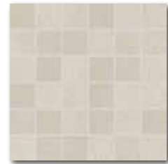
DDM06610 (SET) Unistone PEI 5 72 / set mat | matt

běžová / beige / bežowa бежевый / bézs / beige