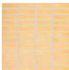
GDMAJ007 (SET) PEI 4 ○ 58 / set lesk | glossy