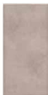
WATMB022 ○ 68 / m 2 lesk | glossy