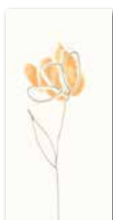
WITMB009 ○ 58 / ks lesk | glossy

bílá / white / biata белый / fehér / blanco