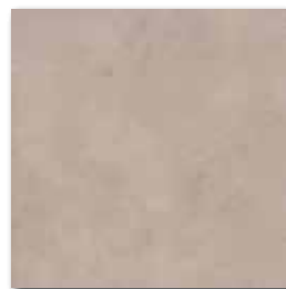
GAT3B195 PEI 3 ○ 74 / m 2 mat | matt

oranžová / orange / pomarańczowa оранжевый / narancs / naranja