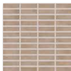
GDMAJ008 (SET) PEI 3 ○ 58 / set lesk | glossy