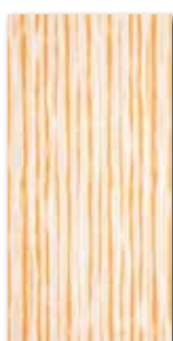
WITMB011 ○ 58 / ks lesk | glossy

bílá / white / biata белый / fehér / blanco