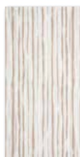
WITMB012 ○ 58 / ks lesk | glossy