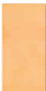
WATMB021 ○ 68 / m 2 lesk | glossy