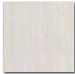
DAR 35030 PEI 5 \odot 72 / m 2 mat | matt

slonová kost / ivory / kość stoniowa слоновая кость / elefántcsont / marfil