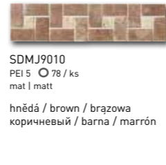
SDM J9010 PEI 5 \odot 78 / ks mat | matt

slonová kost / ivory / kość stoniowa слоновая кость / elefántcsont / marfil