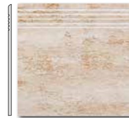
DCP 35035 PEI 5 \odot 44 / ks mat | matt