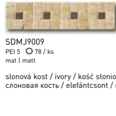
SDM J9009 PEI 5 \odot 78 / ks mat | matt

slonová kost / ivory / kość stoniowa слоновая кость / elefántcsont / marfil