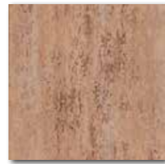
DAR 35037 PEI 5 \odot 72 / m 2 mat | matt

okrová / ochre / ochrowa охра / okker / ocse