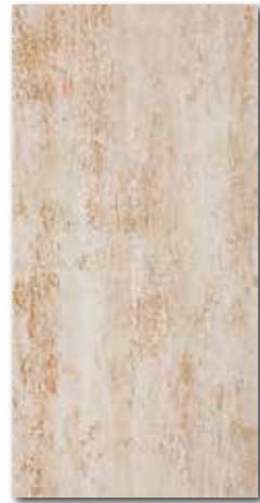
DARS A035 PEI 5 \odot 76 / m 2 mat | matt