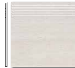
DCA 35030 DCP 35030 PEI 5 \odot 44 / ks mat | matt

hnědá / brown / brązowa коричневый / barna / marrón