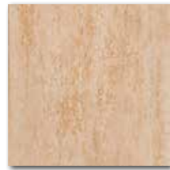
DAR 35034 PEI 5 \odot 72 / m 2 mat | matt

běžová / beige / bežowa бежевый / bézs / beige