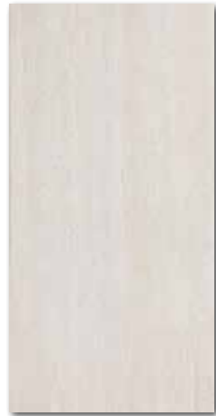
DARS A030 PEI 5 \odot 76 / m 2 mat | matt