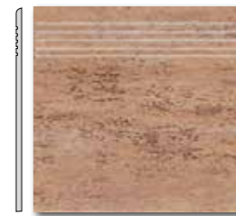
DCA 35037 DCP 35037 PEI 5 \odot 44 / ks mat | matt