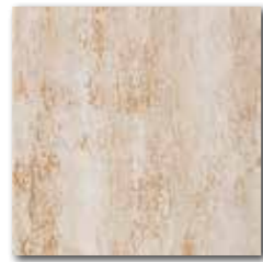
DAR 35035 PEI 5 \odot 72 / m 2 mat | matt

slonová kost / ivory / kość stoniowa слоновая кость / elefántcsont / marfil