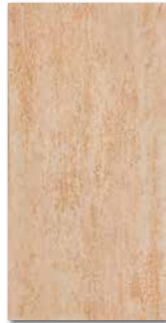
DARS A034 PEI 5 \odot 76 / m 2 mat | matt