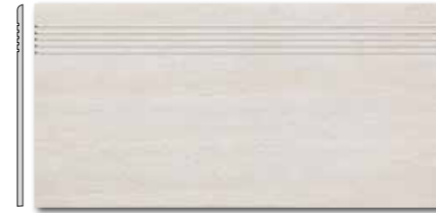
DCP SE030 PEI 5 \odot 72 / ks mat | matt

slonová kost / ivory / kość stoniowa слоновая кость / elefántcsont / marfil