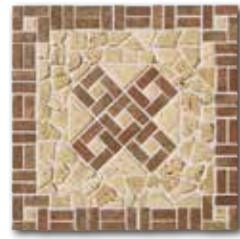
SDM J35009 PEI 5 \odot 102 / ks mat | matt