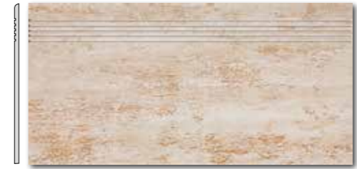
DCP SE035 PEI 5 \odot 72 / ks mat | matt

slonová kost / ivory / kość stoniowa слоновая кость / elefántcsont / marfil