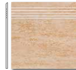
DCP 35034 PEI 5 \odot 44 / ks mat | matt