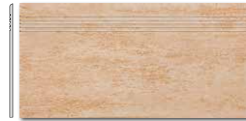
DCP SE034 PEI 5 \odot 72 / ks mat | matt

běžová / beige / bežowa бежевый / bézs / beige