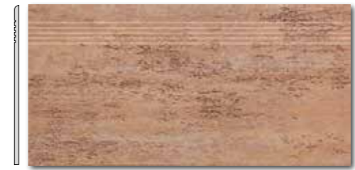
DCP SE037 PEI 5 \odot 72 / ks mat | matt

okrová / ochre / ochrowa охра / okker / ocse