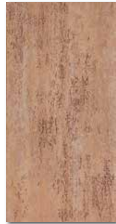
DARS A037 PEI 5 \odot 76 / m 2 mat | matt