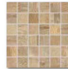
DDM05707 (SET) PEI 4 \odot 72 / set mat | matt béžová / beige / beżowa бежевый / bézs / beige