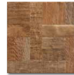
DAR3B708 PEI 4 \odot 72 / m 2 mat | matt