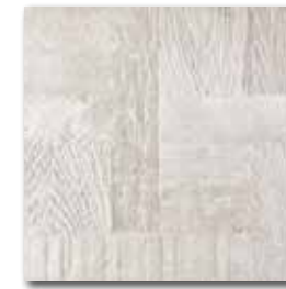
DAR3B706 PEI 5 \odot 72 / m 2 mat | matt