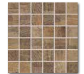
DDM05709 (SET) PEI 4 \odot 72 / set mat | matt hnědá / brown / brązowa коричневый / barna / marrón