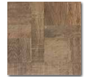
DAR3B709 PEI 4 \odot 72 / m 2 mat | matt