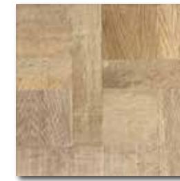
DAR3B707 PEI 4 \odot 72 / m 2 mat | matt