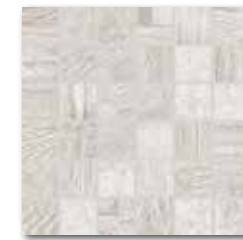
DDM05706 (SET) PEI 5 \odot 72 / set mat | matt bílá / white / biata / белый fehér / blanco