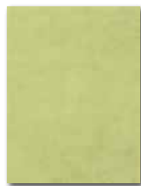
WATKB149 ○ 59 / m 2 lesk | glossy