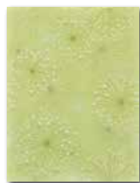
WITKB149 ○ 58 / ks lesk | glossy