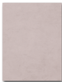
WATKB148 ○ 59 / m 2 lesk | glossy