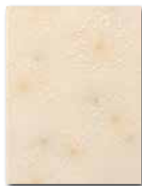
WITKB146 ○ 58 / ks lesk | glossy