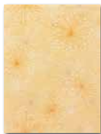
WITKB147 ○ 58 / ks lesk | glossy