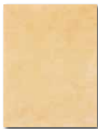
WATKB147 ○ 59 / m 2 lesk | glossy