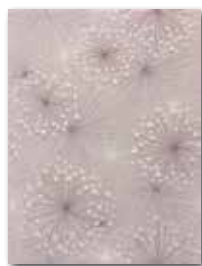
WITKB148 ○ 58 / ks lesk | glossy