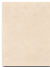
WATKB146 ○ 59 / m 2 lesk | glossy