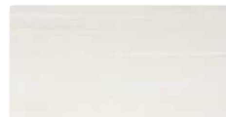
WAKV4530 80 / m 2 mat | matt