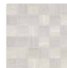
WDM06531 (SET) 66 / set mat | matt

bílá / white / biata / белый / fehér / blanco