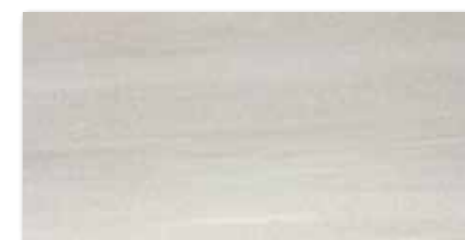
WAKV4531 80 / m 2 mat | matt