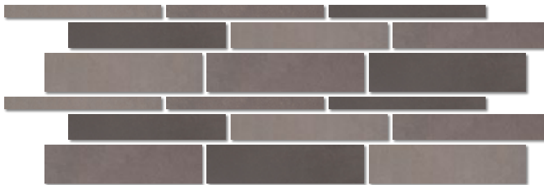
tile combi mix dark