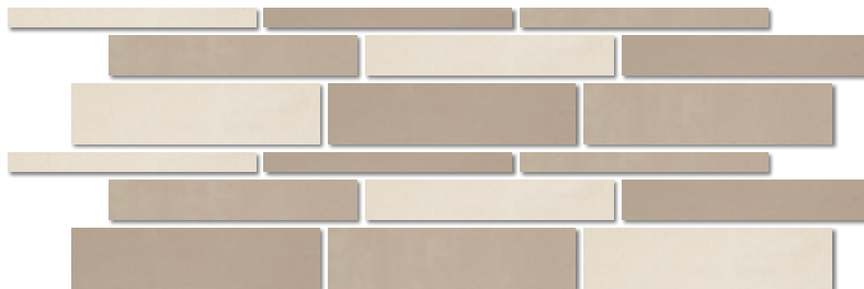
tile combi mix light